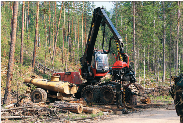
Рис. 3. Древостой без рубки в долине р. Турки полностью сохранился после слабого низового пожара.