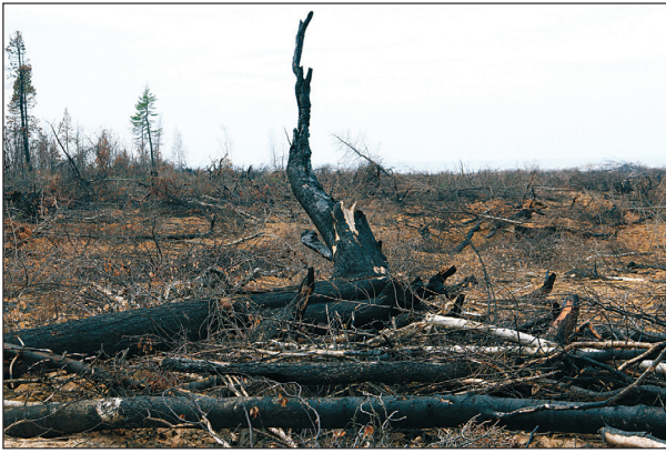
Рис. 1. Придорожное пепелище от торфяного пожара в Центральной экологической зоне Байкала (восточное побережье озера).