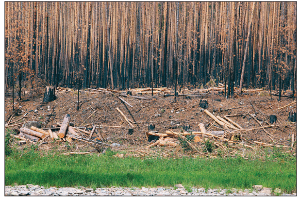
Рис. 2. Гарь в долине р. Турки на участке, где до пожара была проведена «реконструктивная» выборочная рубка древостоя.