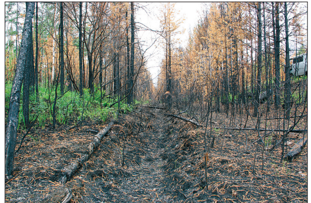
Рис. 4. Минерализованная полоса на квартальной просеке не задерживает распространение интенсивного низового пожара.

венничников ерниками, которые изобилуют по днищам речных долин и способствуют быстрому распространению ландшафтных пожаров.