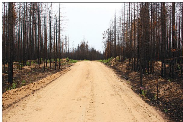
Рис. 5. Верховой пожар в долине р. Баргузин свободно преодолел автотрассу, окаймленную с обеих сторон противопожарными коридорами с минерализованными полосами.

глубь подстилки, а процесс опадения хвои весной протекает очень слабо.